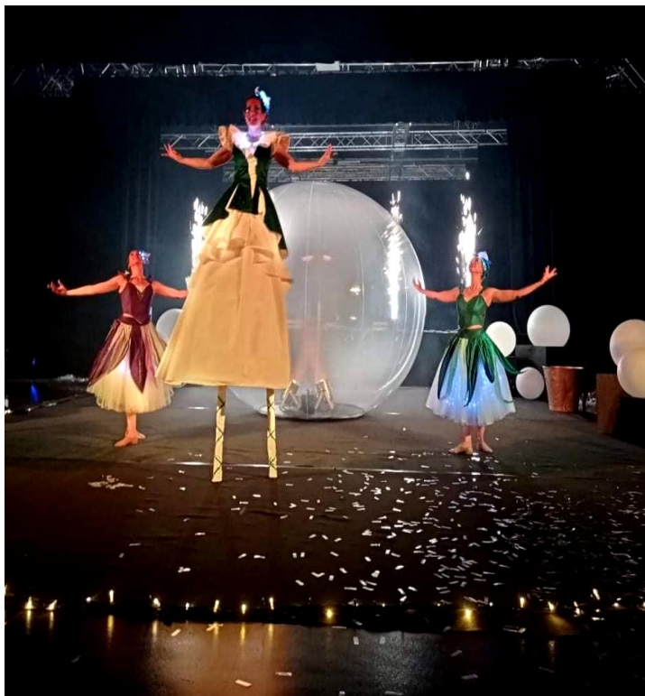
Un spectacle féérique a émerveillé le public au hall de Paris.