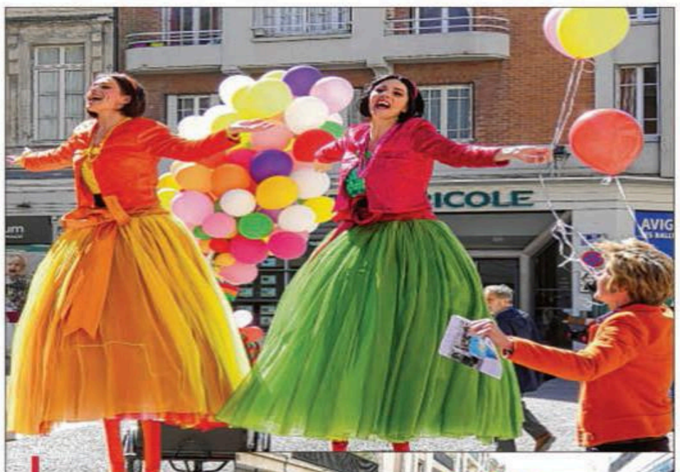
Des ballons colorés, des danseuses juchées sur des échasses, de la musique, du soleil, l'inauguration marque le tant attendu renouveau du quartier des Halles.

L'idée : valoriser le quartier et redonner envie aux Avignonnais de redécouvrir leur centre-ville, d'y faire leurs achats, mais aussi de se rendre au théâtre et dans les différents lieux culturels. "Ce que l'on a aussi souhaité, c'est réintroduire du beau dans l'espace public."