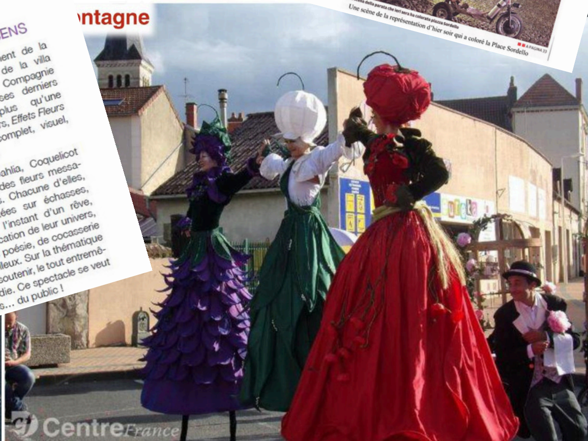
La compagnie Lilou.

des cinq sens, chaque personnage à son sujet à soutenir. Ce spectacle se veut participatif avec une interaction de tous les sens... du public !